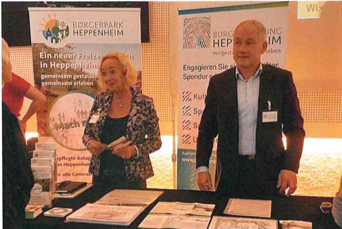
Infostand der Bürgerstiftung Heppenheim im Staatstheater Darmstadt