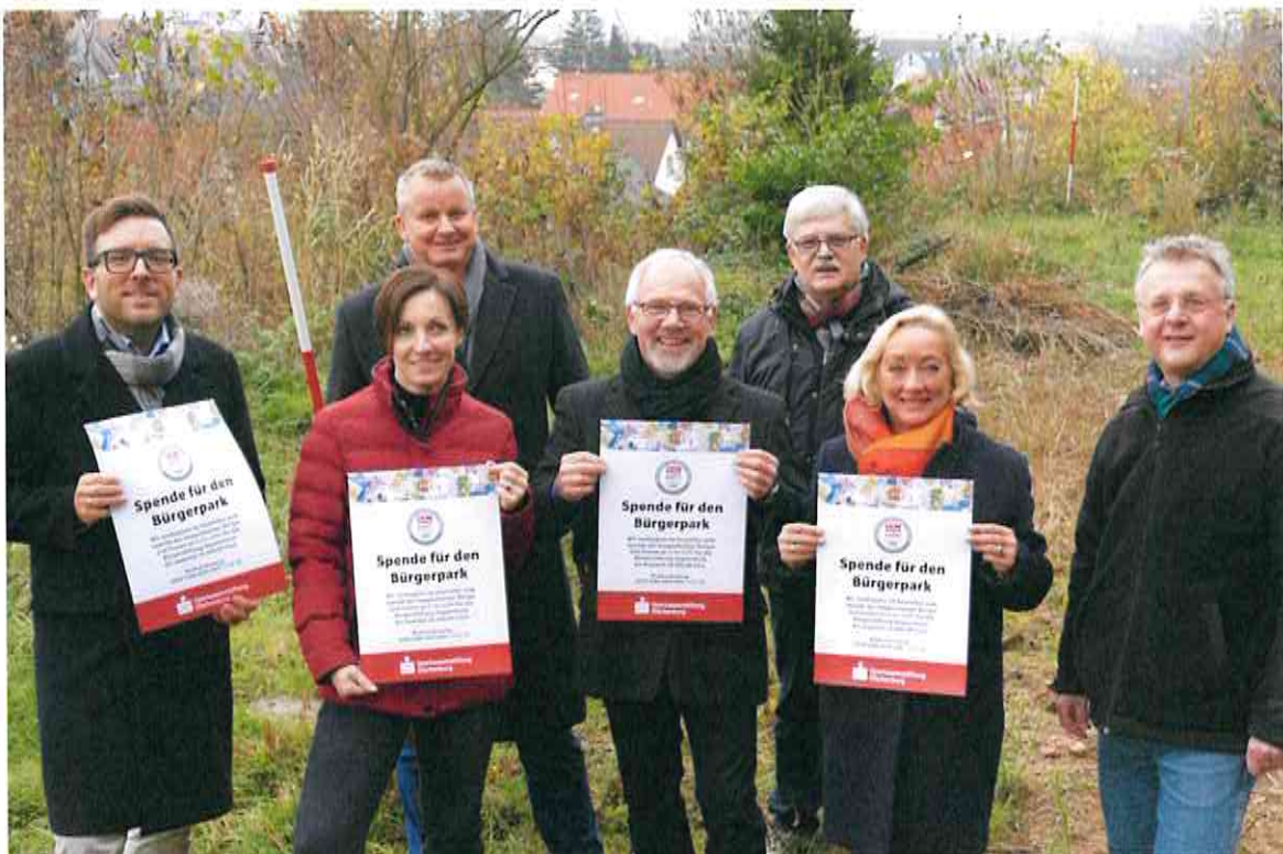
03.12.2019 Start der Spendenaktion der Stiftung Sparkasse Starkenburg